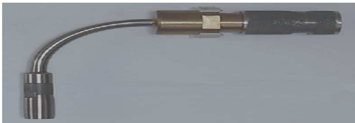
Sonda typu SP-ws

Długość sondy można dobrać tak aby była wystarczająca do przesondowania całej osi pomiarowej w kanale.