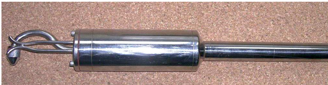
Sonda typu SP-ww80

Długość sondy można dobrać tak aby była wystarczająca do przesondowania całej osi pomiarowej w kanale.