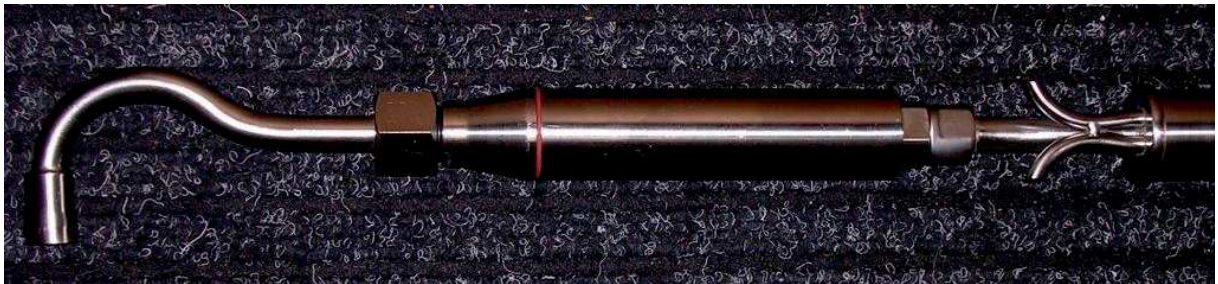
Sonda typu SP-sz z separatorem pyłu FG-30