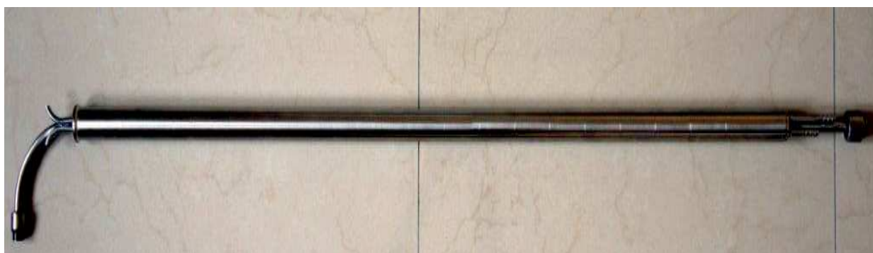
Sonda jednoczęściowa typu SP-ss, nieogrzewana

Długość sondy można dobrać tak aby była wystarczająca do przesondowania całej osi pomiarowej w badanym kanale.