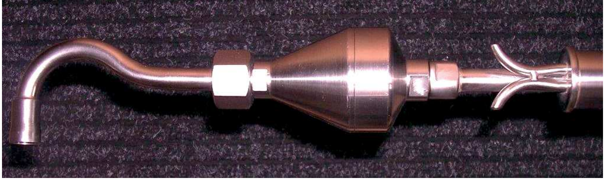
Sonda typu SP-sz z separatorem pyłu FT-50

Długość sondy można dobrać tak aby była wystarczająca do przesondowania całej osi pomiarowej w kanale.