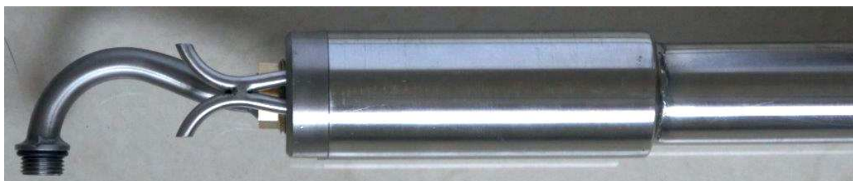
Sonda typu SP-sfw

Długość sondy można dobrać tak aby była wystarczająca do przesondowania całej osi pomiarowej w kanale.