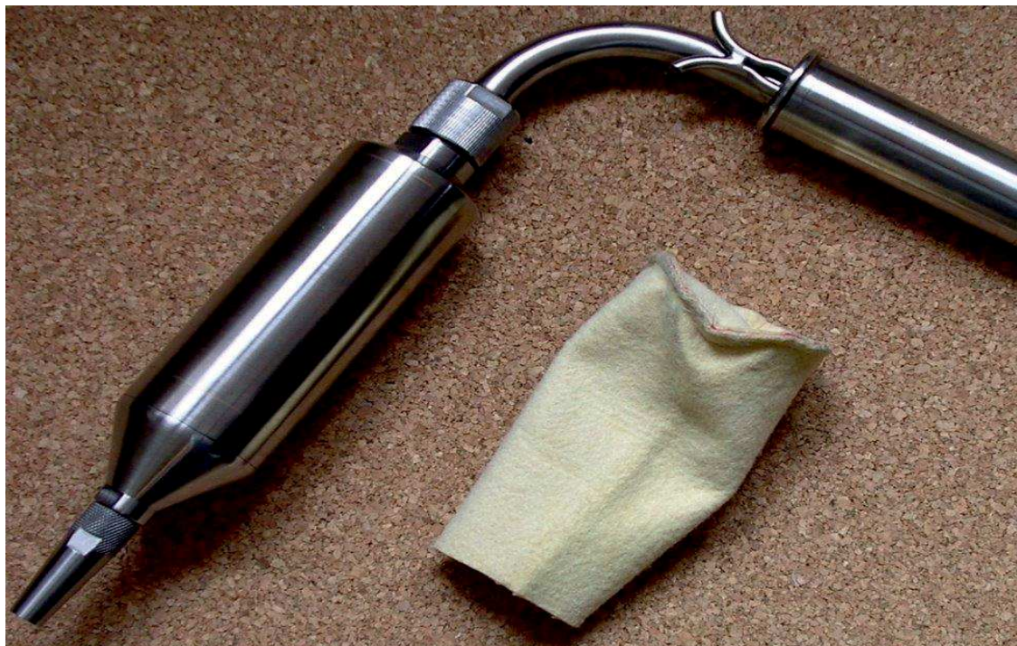
Sonda typu SP-ww60

Długość sondy można dobrać tak aby była wystarczająca do przesondowania całej osi pomiarowej w kanale.