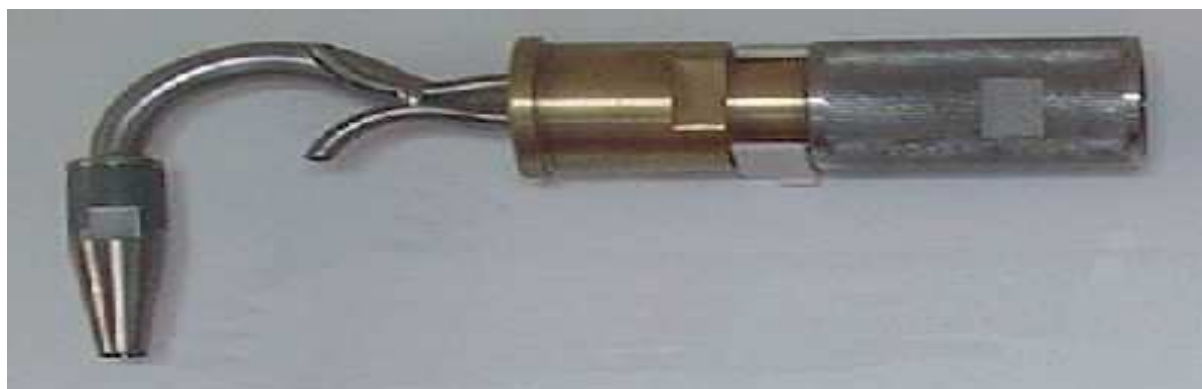
Sonda jednoczęściowa typu SP-so, nieogrzewana

Długość sondy można dobrać tak aby była wystarczająca do przesondowania całej osi pomiarowej w badanym kanale.