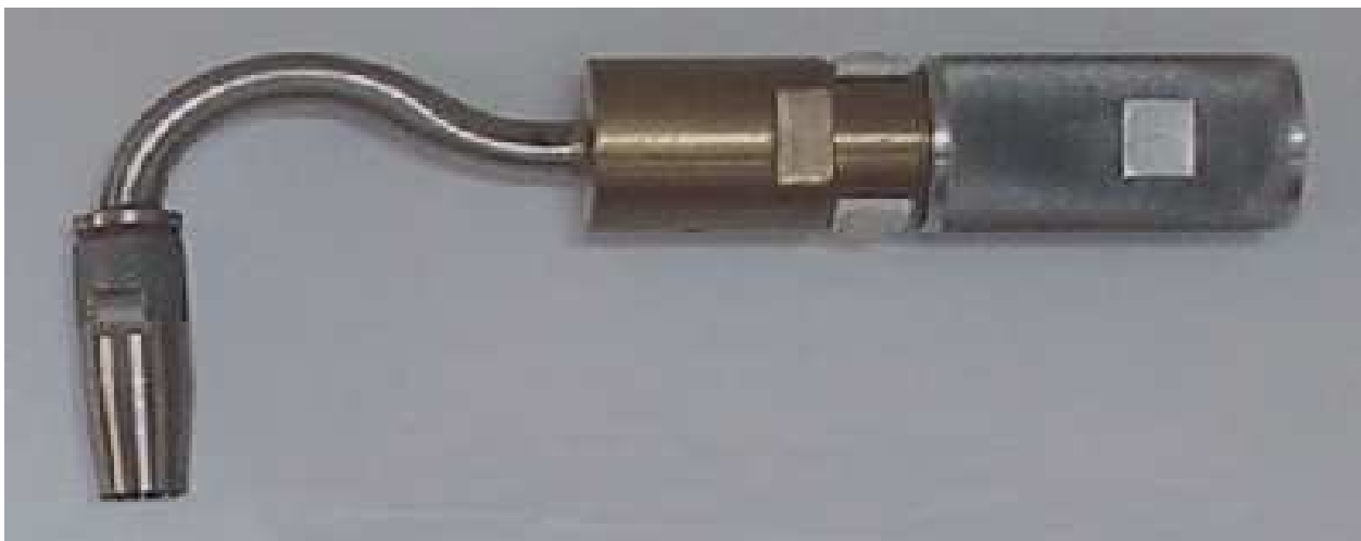
Sonda typu SP-wo

Długość sondy można dobrać tak aby była wystarczająca do przesondowania całej osi pomiarowej w kanale.