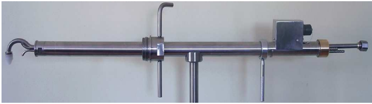
Sonda jednoczęściowa typu SP-so, ogrzewana