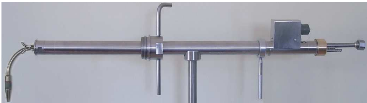
Sonda jednoczęściowa typu SP-ss, ogrzewana